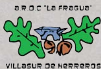
Asociación R.D.C. LA FRAGUA Villasur de Herreros